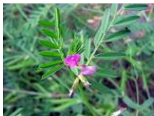
◆春の野の花◆ カラスノエンドウ

夏になるとぷっくりとした小さな豆のさやがたくさんなります。 中身の豆を取り出すと草笛にもなりますよ。「ピーピー豆」とも呼ばれています